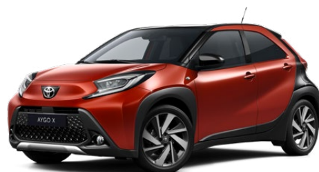
2VH Chilivörös fekete tetővel Felár nélkül Elérhető a Style és Executive felszereltségnél