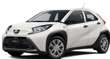
040 Hófehér Felár nélkül Elérhető a Comfort felszereltségnél