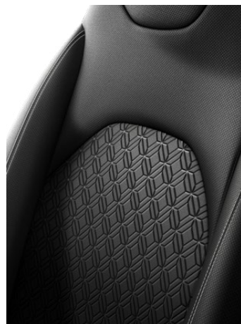
Fekete szövet ülésborítás, fehér varrással Alapfelszereltség: Style 2NR színben