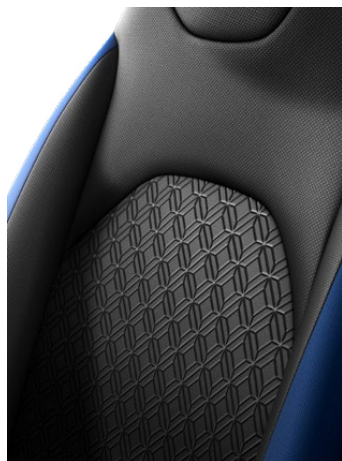
Fekete szövet ülésborítás, oldala a karosszéria színében Alapfelszereltség: Style 2VH, 2VJ, 2VL, 2VN és 2UP színekben