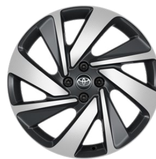
18" könnyűfém keréktárcsák, 175/60 R18 gumiabroncs Alapfelszereltség: Executive