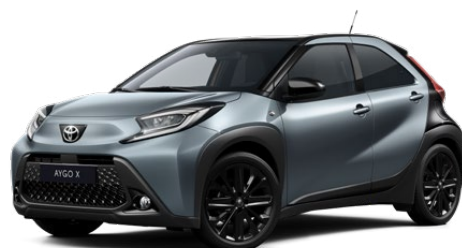
2UP Szürkékék fekete tetővel Felár nélkül Elérhető a Style Design felszereltségnél