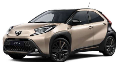
2VJ Gyömbér bézs fekete tetővel Felár nélkül Elérhető a Style Design felszereltségnél