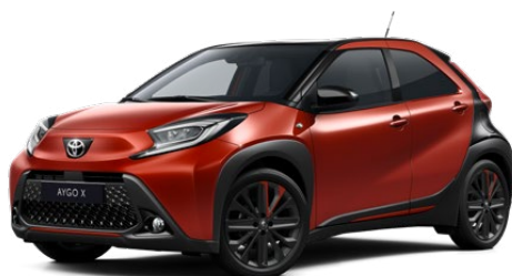
2VH Chilivörös fekete tetővel Felár nélkül Elérhető a Style Design felszereltségnél