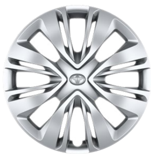
17" acél keréktárcsák díztárcsával, 175/65 R17 gumiabroncs Alapfelszereltség: Comfort