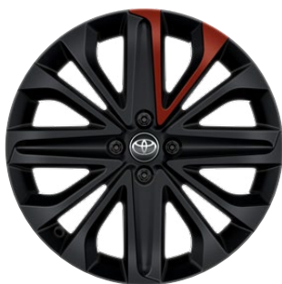
18" matt fekete könnyűfém keréktárcsák piros betéttel, 175/60 R18 Alapfelszereltség: Style Design (2VH és 2VL karosszériaszín)