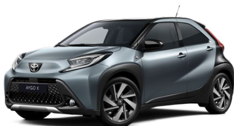
2UP Szürkékék fekete tetővel Felár nélkül Elérhető a Style és Executive felszereltségnél