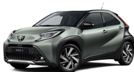
2VN Olivazöld fekete tetővel Felár nélkül Elérhető a Style és Executive felszereltségnél