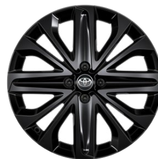
18" matt fekete könnyűfém keréktárcsák éjfeke betéttel, 175/60 R18 Alapfelszereltség: Style Design (2UP és 2VN karosszériaszín)