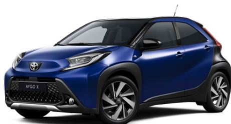
2VL Boróka kék fekete tetővel Felár nélkül Elérhető a Style és Executive felszereltségnél