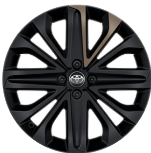
18" matt fekete könnyűfém keréktárcsák bézs betéttel, 175/60 R18 Alapfelszereltség: Style Design (2VJ és 2VK karosszériaszín)