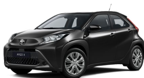
209 Éjfékete* 130 000 Ft Elérhető a Comfort felszereltségnél