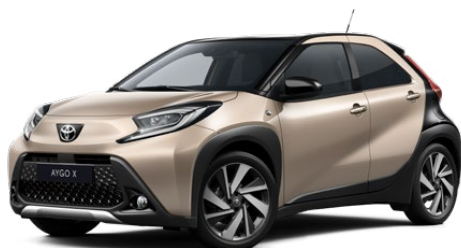
2VJ Gyömbér bézs fekete tetővel Felár nélkül Elérhető a Style és Executive felszereltségnél