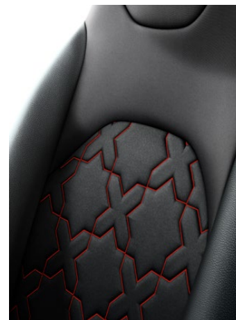
Szövet-bőr (szintetikus) ülésborítás Alapfelszereltség: Executive