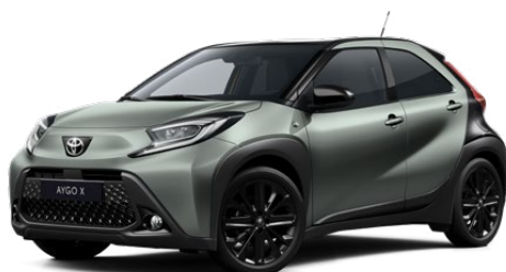
2VN Olivazöld fekete tetővel Felár nélkül Elérhető a Style Design felszereltségnél