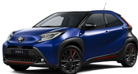
2VL Boróka kék fekete tetővel Felár nélkül Elérhető a Style Design felszereltségnél