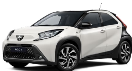
2NR Hófehér fekete tetővel Felár nélkül Elérhető a Style felszereltségnél