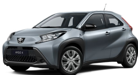
1K3 Szürkékék* 130 000 Ft Elérhető a Comfort felszereltségnél