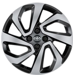
17" könnyűfém keréktárcsák, 175/65 R17 gumiabroncs Alapfelszereltség: Style