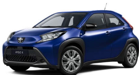
8Y8 Boróka kék* 130 000 Ft Elérhető a Comfort felszereltségnél