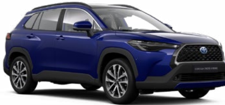
8W7 Kobaltkék* 190 000 Ft