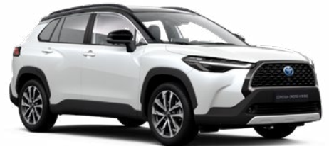
2PS Platina gyöngyfehér fekete tetővel* felár nélkül Executive változathoz