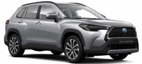
110 Palladium ezüst* 190 000 Ft