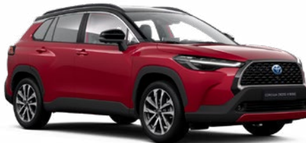
2YD Prémium vörös fekete tetővel* felár nélkül Executive változathoz