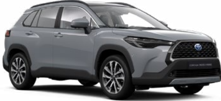
1H5 Manhattan szürke* 190 000 Ft