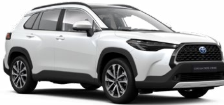
089 Platina gyöngyfehér** 290 000 Ft