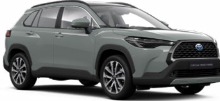
6X3 Oliva zöld* 190 000 Ft