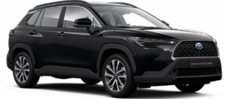
218 Attitude fekete 190 000 Ft