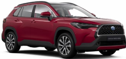
3T3 Prémium vörös** 290 000 Ft