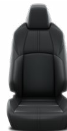
Fekete bőr ülésborítás Alapfelszereltség az Executive felszereltségnél