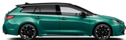
M28 Racing green / Fekete tető különleges fényezés Elérhető a GR SPORT felszereltségeken