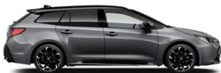
2MB GR SPORT Szürke metál/ Fekete tető Elérhető a GR SPORT felszereltségeken