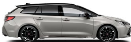
2RD GR SPORT Krómezüst/ Fekete tető Elérhető a GR SPORT felszereltségeken