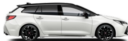
2NR GR SPORT Pure/ Fekete tető Elérhető a GR SPORT felszereltségeken