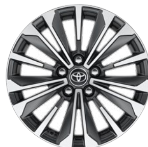
17" könnyűfém keréktárcsák 225/45 R17 gumiabronccsal Alapfelszereltség: Style