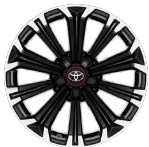
17" könnyűfém keréktárcsák 225/45 R17 gumiabroncsok Alapfelszereltség: GR SPORT