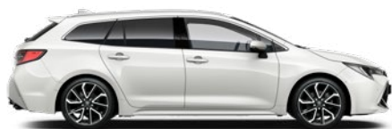
040 Hófehér felár nélkül