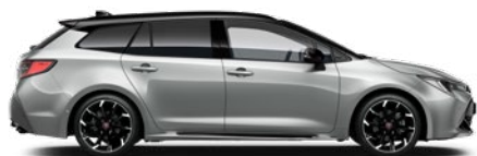
2TX GR SPORT Prémium ezüst/ Fekete tető Elérhető a GR SPORT felszereltségeken