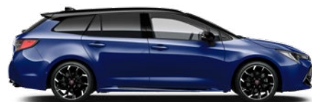
2VL GR SPORT Boróka metál/ Fekete tető Elérhető a GR SPORT felszereltségeken