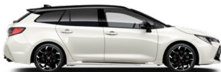
2PU GR SPORT Fehér/ Fekete tető Elérhető a GR SPORT felszereltségeken