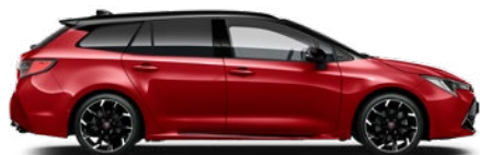
2SZ GR SPORT Passion/ Fekete tető Elérhető a GR SPORT felszereltségeken