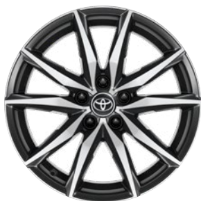
18" könnyűfém keréktárcsák 225/40 R18 gumiabronccsal Alapfelszereltség: GR SPORT Dynamic