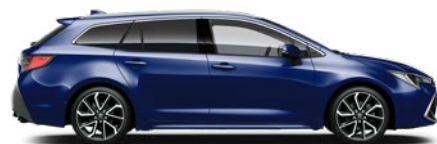
8Y8 Boróka metál* 190 000 Ft