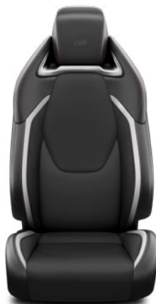
Sötétszürke szövet és szintetikus bőr ülésborítás GR Sport logoval Alapfelszereltség a GR Sport és GR SPORT Dynamic felszereltségnél