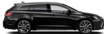
209 Éjfekete* 190 000 Ft