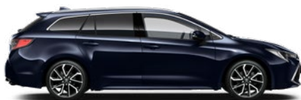
8X8 Sötétkék mica* 190 000 Ft