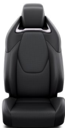
Fekete szövet ülésborítás bőr részekkel és steppelt betétekkel, bézs varrással Alapfelszereltség az Executive és Hybrid Executive felszereltségnél