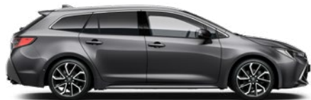
1G3 Szürke metál* 190 000 Ft