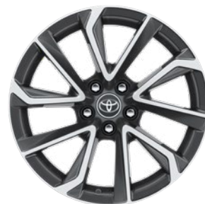
18" könnyűfém keréktárcsák 225/40 R18 gumiabroncsok Alapfelszereltség: Executive