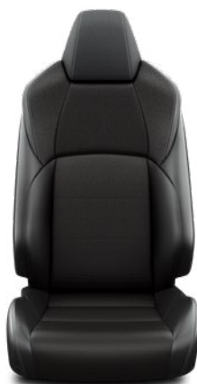
Fekete szövet ülésborítás steppelt fekete betétekkel Alapfelszereltség a Comfort, Comfort Tech és Comfort Style Tech felszereltségnél