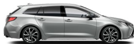
1L0 Prémium ezüst* 190 000 Ft