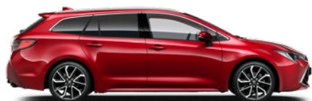
3U5 Érzéki vörös* 290 000 Ft