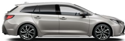
1J6 Krómezüst o 290 000 Ft