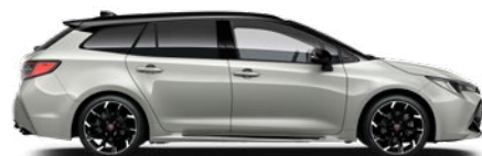
2RZ GR SPORT Higanyszürke/ Fekete tető Elérhető a GR SPORT felszereltségeken