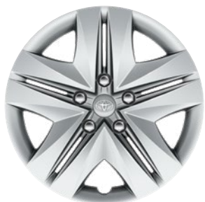
16" acél keréktárcsák 205/55 R16 gumiabroncsok dísz tárcsával Alapfelszereltség: Active