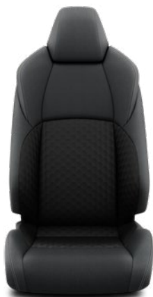
Fekete szövet ülésborítás Alapfelszereltség az Active felszereltségnél