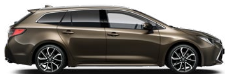
6X1 Barnászöld** 190 000 Ft