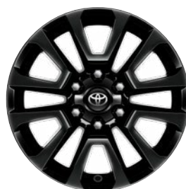
18" matt fekete könnyűfém keréktárcsák Alapfelszereltség az Executive felszereltségi szinten