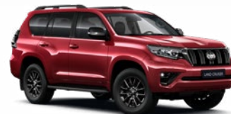
3R3 Barcelona vörös* 330 000 Ft