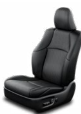
Fekete prémium szövetkárpit Alapfelszereltség a Comfort felszereltségi szinten