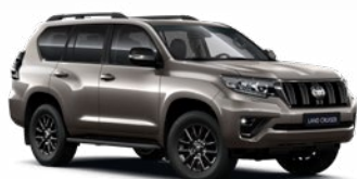
4V8 Avantgard bronz* 330 000 Ft