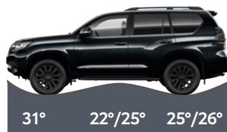
Első terepszög, rámpaszög, hátsó terepszög