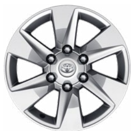
17" könnyűfém keréktárcsa Alapfelszereltség a Prado Family felszereltségi szinten