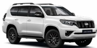
040 Hófehér felár nélkül