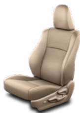
Bézs színű szövetkárpit Alapfelszereltség a Prado Family felszereltségi szinten