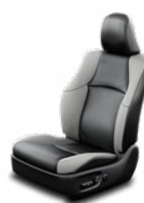
Fekete bőrülés szürke betétekkel Alapfelszereltség az Executive felszereltségi szinten