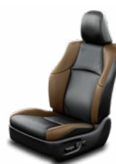
Fekete bőrülés barna betétekkel Alapfelszereltség az Executive felszereltségi szinten