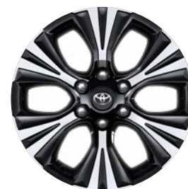
19" könnyűfém keréktárcsa Opcióként rendelhető a Comfort, Invincible és Executive modellekhez