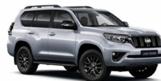
1F7 Ultraezüst* 330 000 Ft