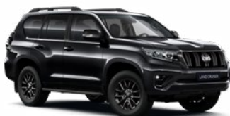
202 Fekete felár nélkül