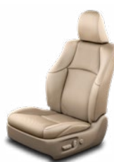
Bézs bőrkárpit (természetes / szintetikus bőr) Alapfelszereltség az Invincible felszereltségi szinten