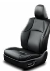
Fekete bőrkárpit (természetes / szintetikus bőr) Alapfelszereltség az Invincible felszereltségi szinten