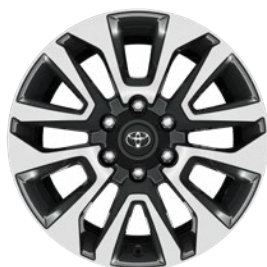
19" kéttónusú csiszolt hatású könnyűfém keréktárcsák Alapfelszereltség Comfort és Invincible felszereltségi szinteken