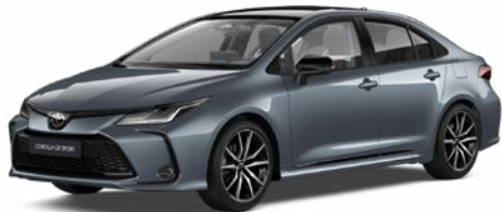
2TH GR-S szürkéskék felár nélkül – GR SPORT