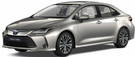
1J6 Krómezüst* 290 000 Ft