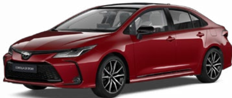
2TB GR-S érzéki vörös felár nélkül – GR SPORT