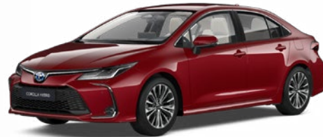
3U5 Érzéki vörös* 290 000 Ft