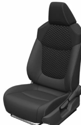
Fekete szövet ülésborítás bőr részekkel és steppelt betétekkel, bézs varrással Alapfelszereltség Hybrid Executive felszereltségnél