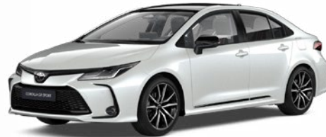
2VP GR-S gyöngyfehér felár nélkül – GR SPORT