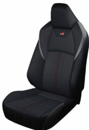
Sötétszürke szövet és szintetikus bőr ülésborítás GR SPORT logoval Alapfelszereltség a GR SPORT és GR SPORT Dynamic felszereltségnél