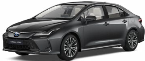
1G3 Szürke metál 190 000 Ft