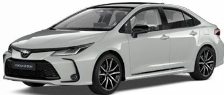
2VF GR-S hamuszürke felár nélkül – GR SPORT