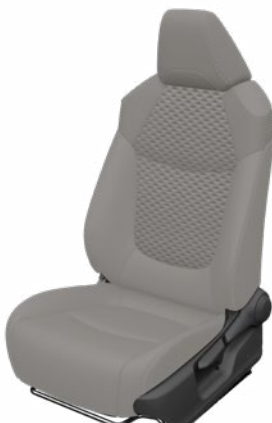
Világosszürke szövet ülésborítás bőr részekkel és steppelt szürke betétekkel, szürke varrással Alapfelszereltség Hybrid Executive felszereltségnél