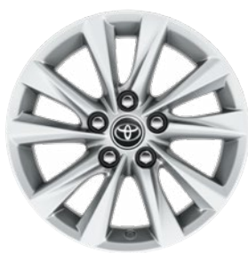
16" könnyűfém keréktárcsák (5 duplaküllös) Alapfelszereltség a Comfort és Hybrid Comfort felszereltségnél