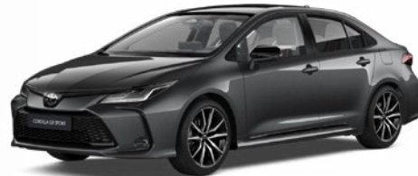
2NB GR-S szürke metál felár nélkül – GR SPORT