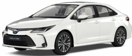
040 Hófehér felár nélkül