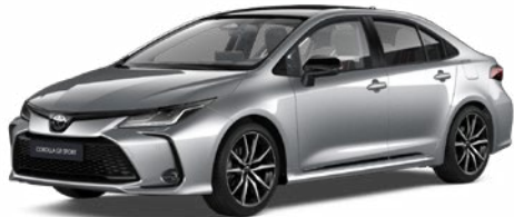
2VU GR-S prémium ezüst felár nélkül – GR SPORT