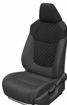
Fekete szövet ülésborítás steppelt fekete betétekkel Alapfelszereltség a Comfort, Comfort Tech és Comfort Style Tech felszereltségnél