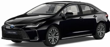
209 Éjfékete* 190 000 Ft