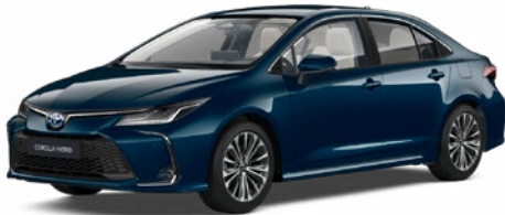
785 Tealevél mély zöld* 290 000 Ft