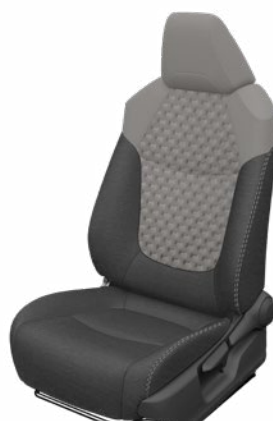
Szürke szövet ülésborítás steppelt világosszürke betétekkel Alapfelszereltség a Comfort, Comfort Tech és Comfort Style Tech felszereltségnél