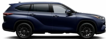
8X8 Sötétkék mica metálfényezés