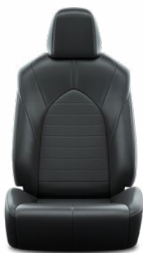
Bőrhátasú szövet Alapfelszereltség a Comfort modellváltozaton