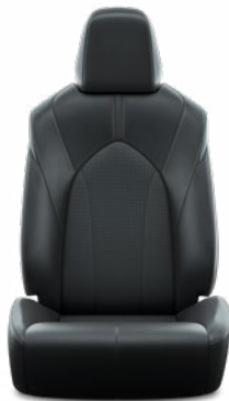
Fekete perforált bőr, steppelt, fekete varrással Alapfelszereltség a Prestige modellváltozaton