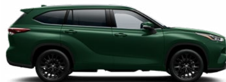
6X5 Ciprus zöld metál metálfényezés