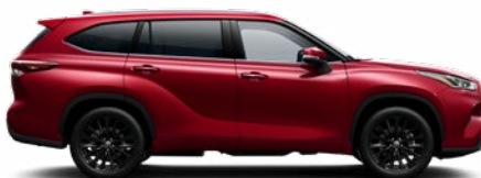
3T3 Vörös prémium metálfényezés