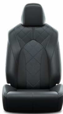
Fekete perforált bőr, gyémántmintázatú, fekete varrással Alapfelszereltség az Executive modellváltozaton