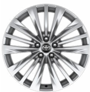
20" ezüstsínű könnyűfém felni 235/55 R20 gumibronccsal Alapfelszereltség a Prestige modellváltozaton