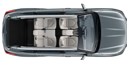
5 ülésel 865* liter