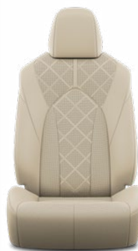
Bézs perforált bőr, gyémántmintázatú, fekete varrással Alapfelszereltség az Executive modellváltozaton