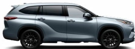
1K5 Holdfény prémium metálfényezés