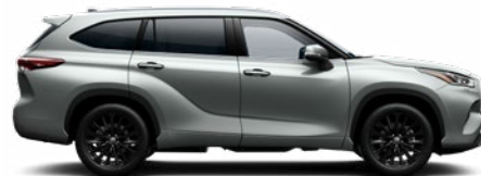
1J9 Ezüstmetál metálfényezés