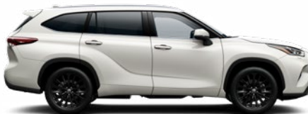
089 Platinagyöngy prémium gyöngyház fényezés