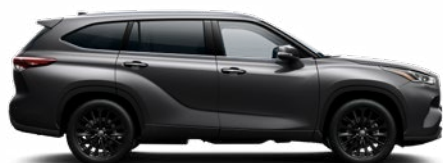
1G3 Hamuszürke metálfényezés