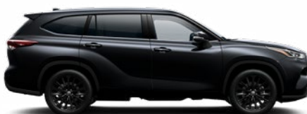
218 Fekete gyöngyház metálfényezés

A Highlander ügyfélárak tartalmazzák a metálfény felárat, a prémium fényezés felárat a Premium felszereltségek tartalmazza.