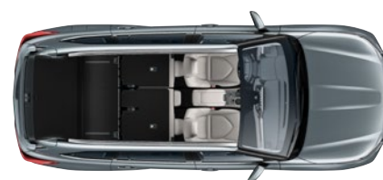
2 ülésel 1909* liter