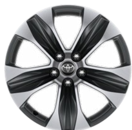
18" sötétszürke, csiszolt felületű könnyűfém felni (5 küllős) 235/65 R18 gumibronccsal Alapfelszereltség a Comfort modellváltozaton