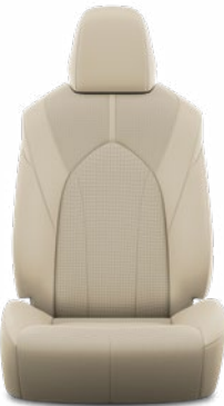
Bézs perforált bőr, steppelt, fekete varrással Alapfelszereltség a Prestige modellváltozaton