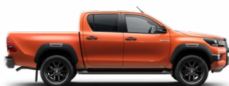
4R8 Narancsmetál Metálfényezés nettó 255 000 Ft bruttó 323 850 Ft