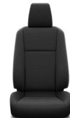
Ovális mintázatú fekete szövet Alapfelszereltség a Live modellváltozaton