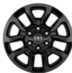
18" fekete könnyűfém keréktárcsa (5 küllős) Alapfelszereltség az Invincible modellváltozaton