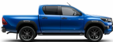
8X2 Vízkék Metálfényezés nettó 255 000 Ft bruttó 323 850 Ft