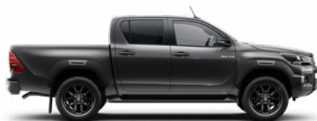
1G3 Hamuszürke Metálfényezés nettó 255 000 Ft bruttó 323 850 Ft