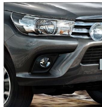
Ködlámpák 336 700 Ft