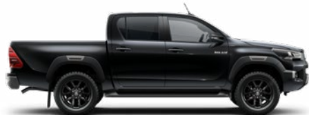
218 Fekete gyöngyház Metálfényezés nettó 255 000 Ft bruttó 323 850 Ft