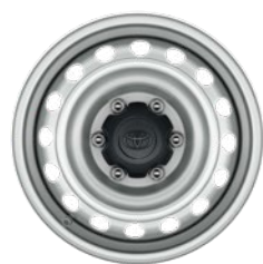
17" ezüst színű acél keréktárcsa Alapfelszereltség a Live szimplakabinos modellváltozaton