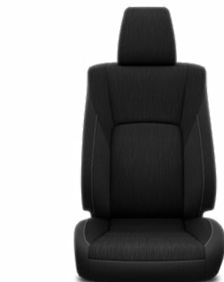
Függőleges mintázatú fekete szövet Alapfelszereltség az Active és Executive modellváltozaton