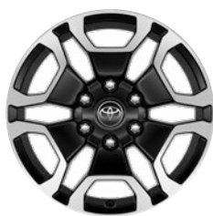
18" fekete, csiszolt felületű könnyűfém keréktárcsa (6 küllős) Alapfelszereltség az Executive modellváltozaton