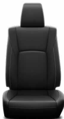
Fekete bőr Alapfelszereltség az Executive Leather modellváltozaton