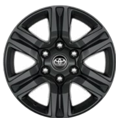
17" sötétszürke könnyűfém keréktárcsa (6 küllős) Alapfelszereltség az Active modellváltozaton