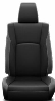
Kéttónusú perforált bőr Alapfelszereltség az Invincible modellváltozaton