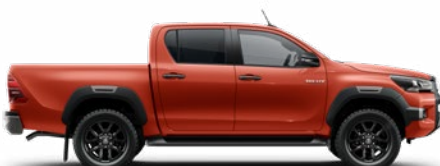
3E5 Chilipiros Metálfényezés Felár nélkül

* Szimplakabinos változatok esetén nem érhető el.