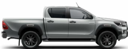
1D6 Ezüstmetál Metálfényezés nettó 255 000 Ft bruttó 323 850 Ft