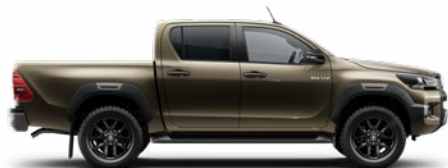
6X1 Barnászöld Metálfényezés nettó 255 000 Ft bruttó 323 850 Ft