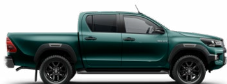
6S3 Óáziszöld Metálfényezés Felár nélkül