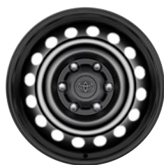
17" fekete acél keréktárcsa Alapfelszereltség a Live extra- és duplakabinos modellváltozaton