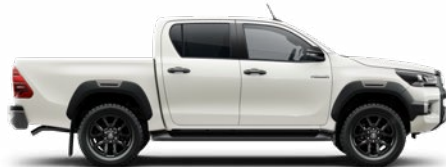
089 Gyöngyfehér* Metálfényezés nettó 310 000 Ft bruttó 393 700 Ft