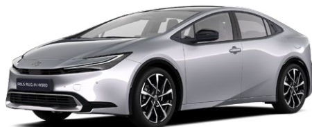
1L0 Palladium ezüst* 200 000 Ft