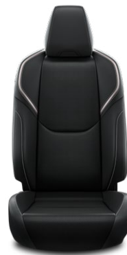
Fekete mesterséges bőr ülésborítás Széria az Executive szereltségben