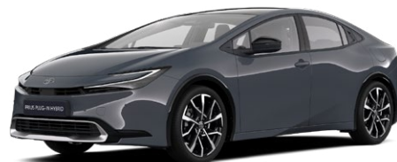
1M2 Hamu szürke* 300 000 Ft