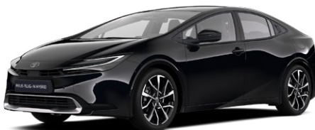
218 Fekete metál* 200 000 Ft