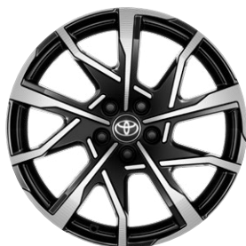
19" csiszolt hatású fekete könnyűfém keréktárcsák 195/50 R19 gumiabroncsokkal Széria a Prestige és Executive szereltségben