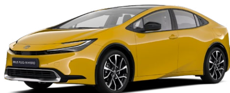
5C5 Mustársárga metál* 200 000 Ft