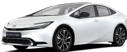
089 Gyöngy fehér 300 000 Ft