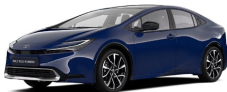
8Q4 Sötétkék felár nélkül