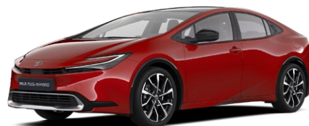
3U5 Érzéki Vörös 300 000 Ft