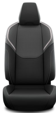
Fekete szövet ülésborítás Széria a Comfort és Prestige szereltségekben