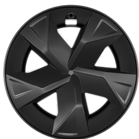
17" sötétszürke könnyűfém keréktárcsák aerodinamikai terelővel 195/60 R17 gumiabroncs Széria a Comfort szereltségnél