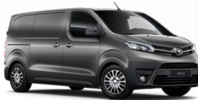
EVL Sólýomszürke Metálfényezés, (nettó ár/bruttó ár): 160 000 Ft/203 200 Ft