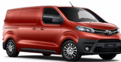
KKX Narancspiros Metálfényezés, (nettó ár/bruttó ár): 160 000 Ft/203 200 Ft