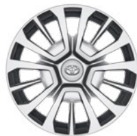
16" acél keréktárcsák dísz tárcsával