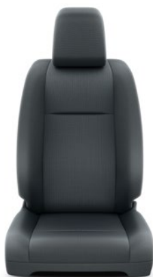
Szürke ülésborítás PVC kombinációval