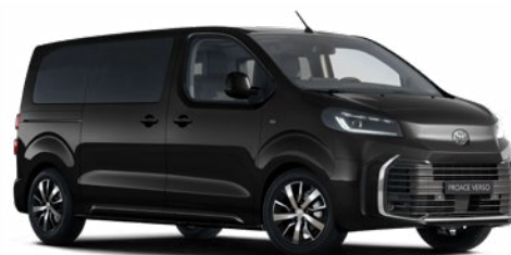
KTV Éjfékete Metálfényezés Bruttó 200 000 Ft