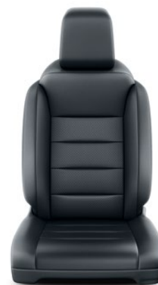
Fekete bőr Alapfelszereltség VIP modelleken