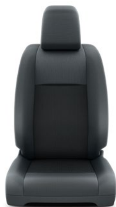
Fekete szövet ülésborítás Alapfelszereltség Combi modelleken