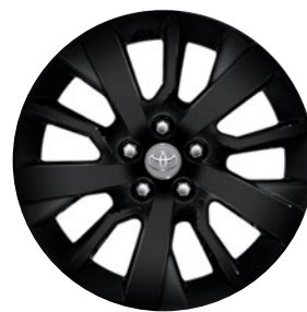
17" fekete könnyűfém keréktárcsák