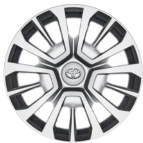
16" / 17" acél keréktárcsák dísz tárcsával