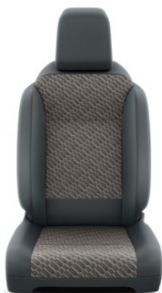
Fekete szövet barna betétekkel Alapfelszereltség Family modelleken