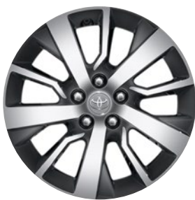
17" könnyűfém keréktárcsák