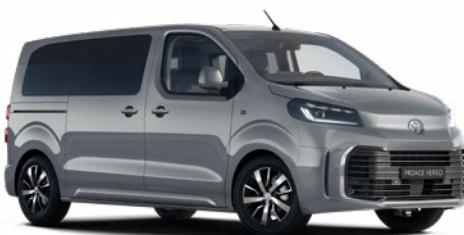
KKJ Titánszürke Metálfényezés Bruttó 200 000 Ft