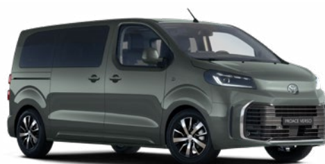
EDU Terepzöld Metálfényezés Bruttó 200 000 Ft

A karosszéria színe a felszereltségi szinttől is függhet.