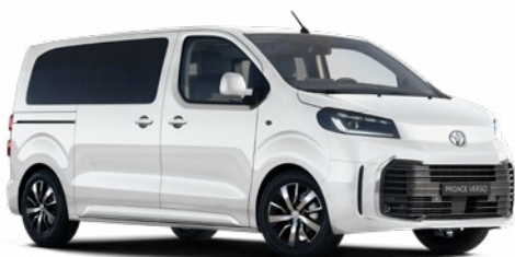
EPR Hófehér felár nélkül