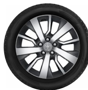
Komplett téli szerelt kerék szett (4 db)

Téli szerelt kerék 17"-TMEWA00052DY 205/55 R17 95V Bridgestone LM005 alufeltnivel