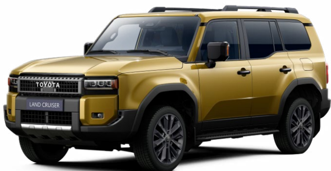
5C8 Sivatagi homok