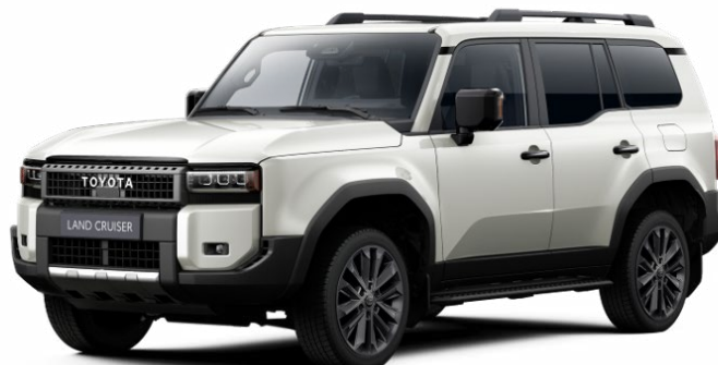
089 Platina fehér*